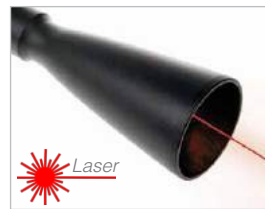
Módulo de largo alcance