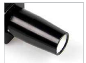
Módulo de enfoque cercano